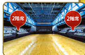
どの席種からも見やすい会場です。