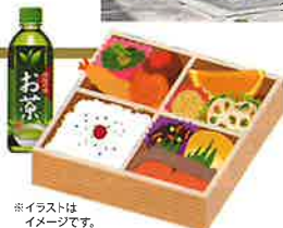
※イラストはイメージです。