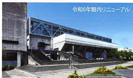
令和6年館内リニューアル