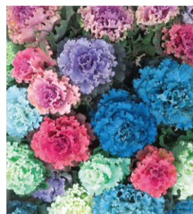
カラフルなカラー葉ボタン(いろはボタン)

時期/11~12月 主な産地/瀬戸内、足守、加茂川 お正月のイメージが強い葉ボタン。染色に適した品種が登場したことを機に4年前からアレンジメントなど新たな需要を見据え、カラーバリエーションを増やしました。これにより、長期間楽しめるよう作付けを拡大し、出荷期間を広げていきたいと考えています。